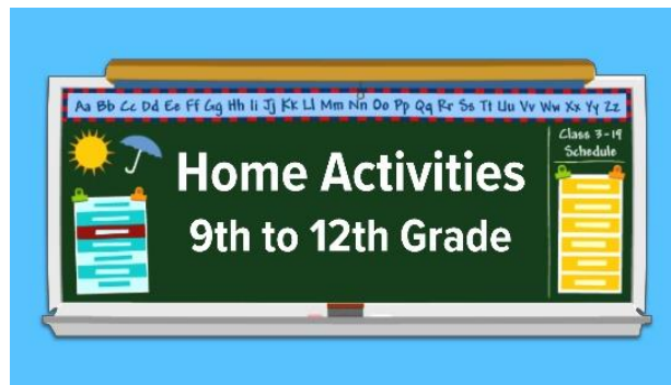
Home Activities 9-12

Esta página presenta actividades e ideas apropiadas para el desarrollo en línea y fuera de línea que son simples, significativas y lo mejor de todo ... ¡divertidas! Haga clic en el nivel de grado de su hijo para comenzar. Si es un educador, asegúrese de explorar los paquetes de lecciones de aprendizaje a distancia. ¿Se pregunta por dónde empezar? Mire nuestro video tutorial rápido sobre cómo usar BrainPOP para apoyar el aprendizaje en casa.